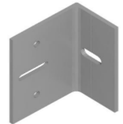
Sujección del perfil